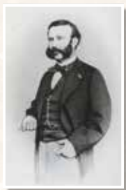
アンリー・デュナン