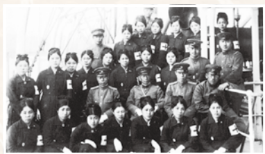
戦地へ派遣された医師と看護婦