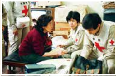
西宮市高木小学校での巡回診療