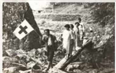
朽木村針畑方面に向かう巡回診療