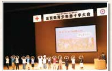
守山市民ホールで開催された記念大会の様子