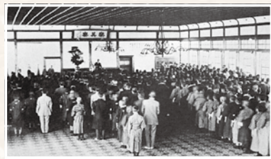
少年赤十字団の結成式(守山尋常高等小学校)