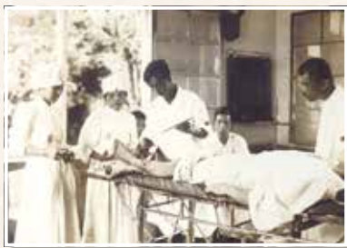
敦賀衛成病院での救護活動