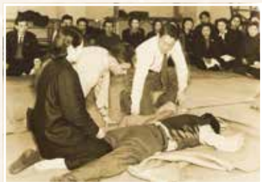
アメリカ赤十字の指導を受ける医師、看護婦