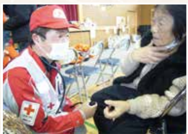
発災直後の避難所にかけていた救護班(宮城県多賀城市)