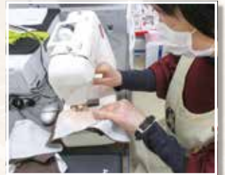
手作りマスクを作製する赤十字奉仕団