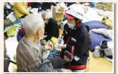
輪島市の避難所で活動する救護班