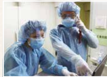
新型コロナウイルス感染症への対応を行う看護師