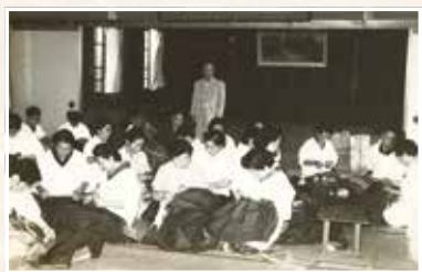
守山町赤十字奉仕団による布団縫い