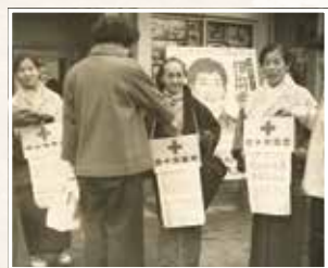
滋賀会館前での募金活動