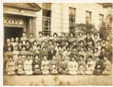
支部事務所前での記念撮影