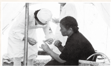
被災者を手当てする救護員