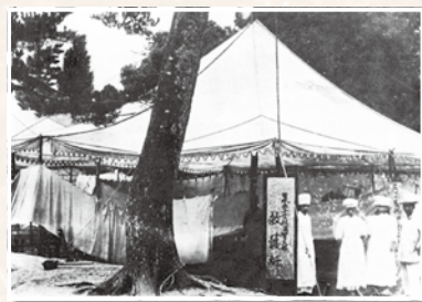
虎姫町五村の臨時救護所