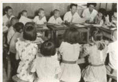
プログラム委員会の様子