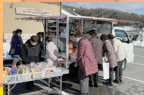
移動販売時の様子