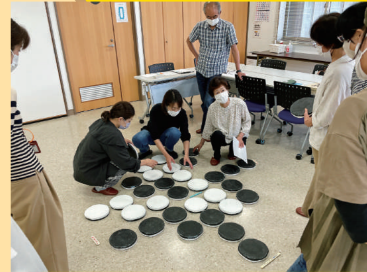
サロンボランティア交流会 での特大オセロ体験