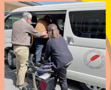
転倒予防教室の送迎支援