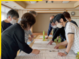
防災・福祉マップを 活用した情報共有