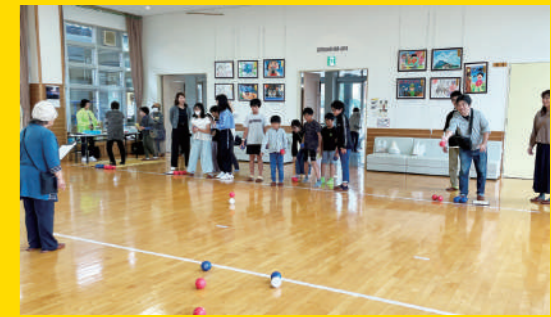
金太郎フェスでの ポッチャ体験