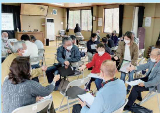
見守り活動研修会