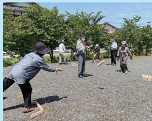
サロン活動（モルック）

交流の機会を現状に合った形で開催することにより、つながりづくりの推進と活動の担い手育成に取り組みます。