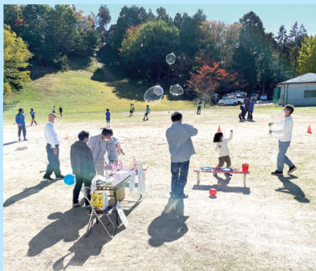
みんなが楽しめる交流（文化祭）

これらの地域の取り組みは自治会、まちづくり協議会、地区社協、民児協、福祉団体、施設、地域包括支援センター、行政、社協などが連携して、気楽につながるまちかんだを目指していきましょう。