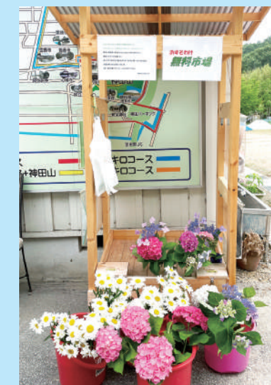
おすそわけ無料市場

買い物や除草作業など、日常生活でのちょっとした手助けを必要とする人への支援等に取り組みます。