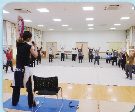
きんたろう転倒予防教室