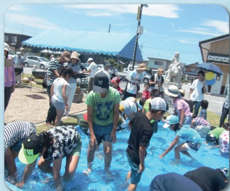
福祉の日による鮎つかみ交流