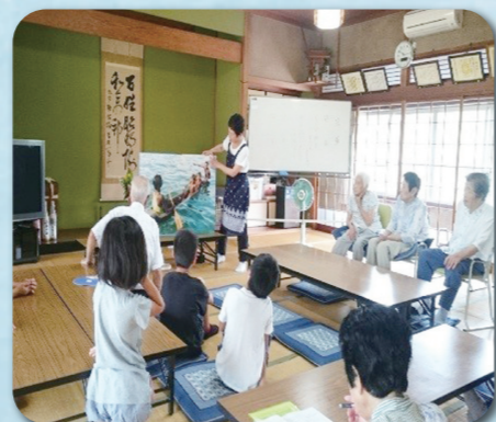
各自治会のサロン活動