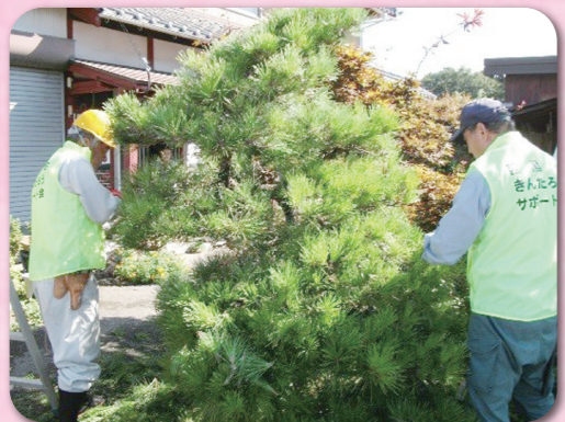
きんたろうサポート会による生活支援